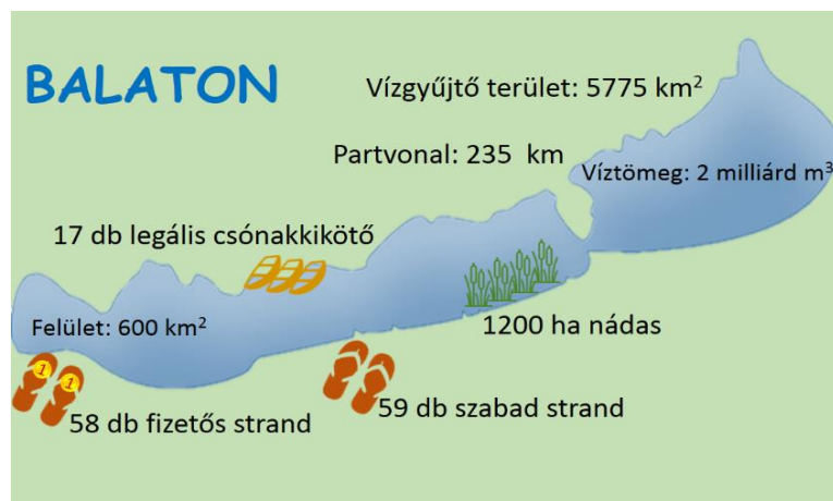
3. ábra: Statisztikai adatok a Balatonról