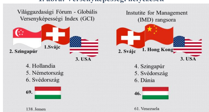
1. ábra: Versenyképességi helyezések

A versenyképesség fogalmára nincs egységes definíció , tartalmát a közgazdászok, kutatók vagy kutatóintézetek sok esetben eltérően értelmezik. Mivel a versenyképességi elemzések elméleti alapjai egymástól különböznek, vagy nem tisztázottak, ez megnehezíti azok eredményeinek összehasonlíthatóságát. Török Ádám a makroszintű versenyképességi elemzéseket három csoportra osztja: a kínálati (a) és a keresleti oldali (b) megközelítésekben a versenyképesség fő meghatározói a külgazdasági teljesítmény költség tényezői (a) illetve magának a teljesítménynek az értéke (b), míg a harmadik megközelítés szerint a versenyképesség átfogó, a gazdaság általános állapotjelzője (c). Ez utóbbit képviselik az országok versenyképességi rangsorait évente rendszeresen megjelentető intézetek is ( Világgazdasági Fórum , IMD ) (Török, 2014). Ezen intézetek egymástól részben eltérő, de kidolgozott módszertannal dolgoznak, globális és a részterületekre vonatkozó eredményeik jól értékelhetők.